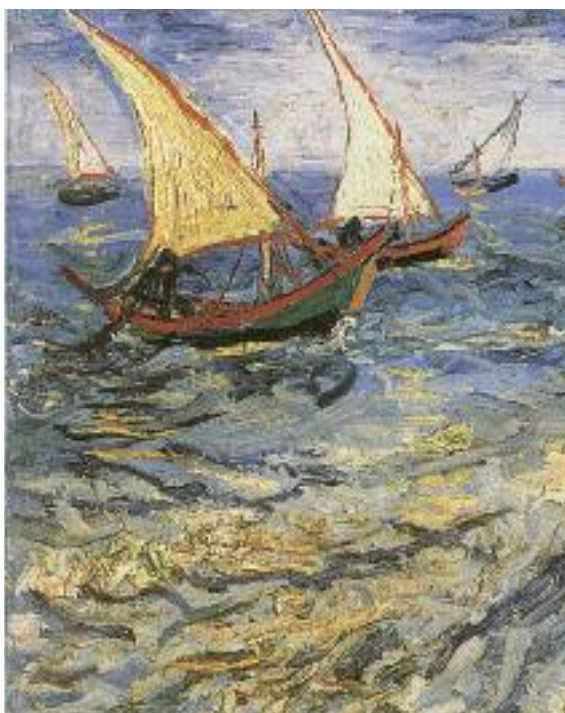
Vincent Van Gogh, Barche di pescatori , 1888. Bruxelles, Musées Royaux des Beaux-Arts.

Intervento. Nel 2009 hai detto alla CdO: «Che la carità penetri negli interstizi dei nostri calcoli deve essere sempre davanti a noi come ideale, come tensione da avere. Perché noi, essendo tutti peccatori, non siamo per niente esenti dal decadere della gratuità e finire nel puro calcolo, pensando che siamo preservati solo perché apparteniamo a una amicizia come la nostra. Il rischio, e non solo, di arroccarsi in una difesa corporativa di ciò che facciamo, magari con dentro un progetto di egemonia politica, è sempre in agguato. Che la gratuità sia l'estrema convenienza significa una gara nel cercare il bene che passa per il rispetto delle leggi, ma che fa di questa gratuità affezione, costruzione per il bene comune, correzione senza reticenze di fronte alla continua caduta» (J. Carrón, «La tua opera è un bene per tutti», Tracce , n. 11/2009, p. VIII). Questo ha iniziato a essere per noi un punto di lavoro. Racconto un fatto. In un recente lavoro istituzionale siamo stati chiamati a dare il nostro giudizio su un progetto di legge in tempi strettissimi. Questo poteva essere una grandissima fonte di lamento: la solita pubblica amministrazione che fa finta di tenere conto delle