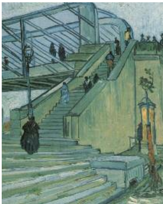
Vincent Van Gogh, Il ponte di Trinquetaille , 1888. Collezione privata.

trodurre e sviluppare alcune funzioni che finora non erano consuete, quali, per esempio, quella commerciale o quella gestionale. Bisogna rivedere la tipologia e la qualità dei servizi. Bisogna insomma interagire profondamente con la realtà che abbiamo davanti, con un contesto in profondo divenire. Non nego che questo lavoro non sia spontaneo né naturale. «Cosa stiamo facendo?», «Dove stiamo andando?»: sono domande che costantemente ci poniamo tra di noi. Affrontandole, viene spesso a galla la domanda sull'origine dell'opera, sullo scopo. Tante nostre cooperative, infatti, sono nate da esperienze di volontariato, di caritativa, magari un po' pionieristiche, tanti anni fa, in modo assolutamente innovativo per rispondere con generosità ai bisogni delle persone incontrate, e chi le ha fonda-