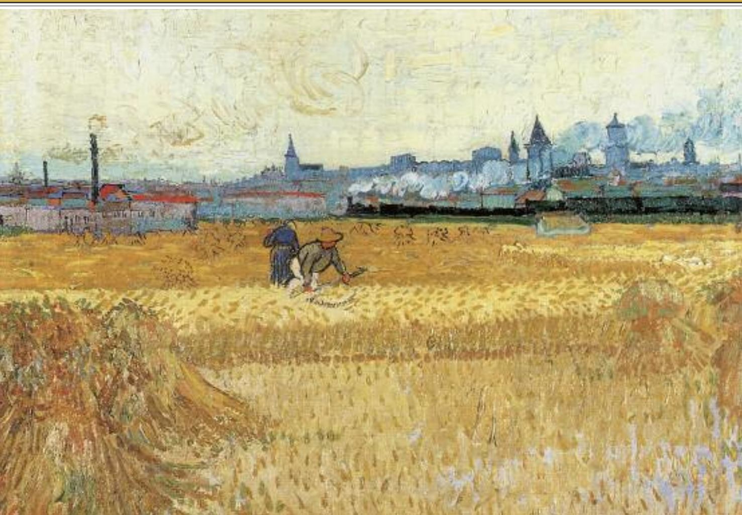
Vincent Van Gogh, I mietitori , 1888. Parigi, Museo Rodin.

re - come ciascuno può riconoscere subito dalla propria esperienza - per incominciare a essere liberi, è riconoscere che ogni opera, ogni tentativo di risposta a un bisogno è sempre imperfetto. E questo non soltanto perché siamo peccatori: anche il santo più santo non può fare che un tentativo ironico. Se cominciamo a riconoscere l'imperfezione di ogni atto umano, di ogni gesto umano, di ogni tentativo umano, allora potremo pian piano essere liberi di cominciare a guardare quello che non va, a riconoscerlo, senza sentirci giudicati o messi in discussione soltanto per questo, perché appartiene a ogni gesto umano l'essere imperfetto. Malgrado questo, che riconosciamo tutti perché ne facciamo esperienza ogni giorno, a volte - come dite - siamo disponibili a riconoscere le cose che vanno bene enfatizzando i successi, ma siamo meno disponibili a riconoscere i punti critici. Perché? Perché c'è una grande paura. Io lo ricordo bene, non c'era cosa meno piacevole per i docenti della scuola dov'ero preside che giudicare che cosa succedeva. Io facevo una domanda molto semplice: «Un ragazzo che viene nella nostra scuola, dopo quattro anni di liceo che esperienza ha fatto? Possiamo dare un giudizio per